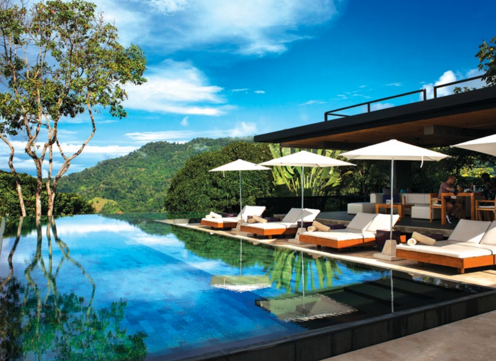
In questa pagina, immagini del Kurà Design Villas , boutique hotel con 8 suite nel Marino Ballena National Park

una riserva naturale tropicale con spiaggia di sabbia bianca, palme frondose e ombreggianti e fondali da sogno. Si passa poi al paradiso per i whale-watcher nel Marino Ballena National Park , che ospita al largo delle sue coste la più grande barriera corallina dell'area. Non solo balene (che qui migrano tra agosto-novembre e dicembre-aprile), ma anche tartarughe olivacee e delfini , tra gli altri. L'indirizzo chic per vivere al meglio il parco è il Kurà Design Villas , boutique hotel con 8 suite, ristorante gourmet vista foresta e romantiche piscine a sfioro. L'idea in più, se si sceglie il Kurà, è di dedicare almeno mezza giornata al relax sulla famosa spiaggia di Ventanas , con una rena finissima e di un bianco abbagliante, sulla quale si erge un imponente arco roccioso scavato dal vento, location perfetta per portarsi a casa uno dei tanti selfie indimenticabili.